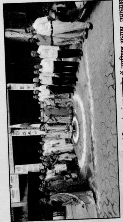
स्वतंत्रता दिवस के उपलक्ष में आयोजित झंडाबंधन समारोह में उपस्थित अध्यक्ष, उपाध्यक्ष, संचालकगण एवं कर्मचारी।