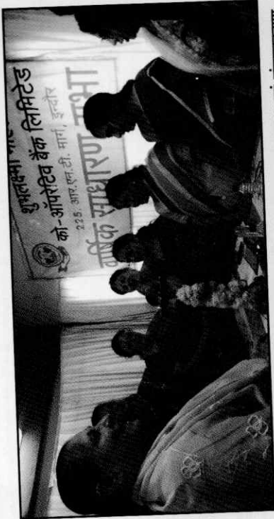
वार्षिक साधारण सभा में दीप प्रज्वलित करते हुए अध्यक्ष, उपाध्यक्ष एवं संचालकगण