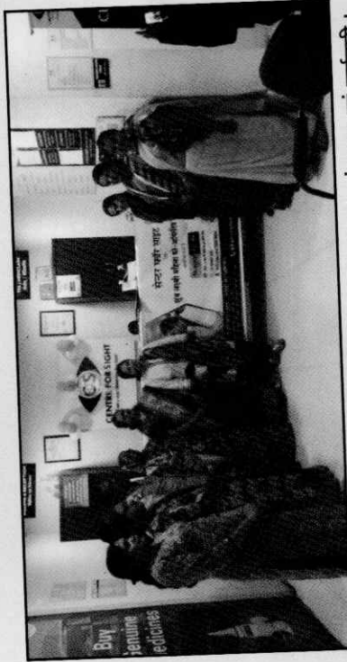
बैंक द्वारा आयोजित नेत्र शिविर में उपस्थित सदस्य, ग्राहक, संचालक एवं कर्मचारी।